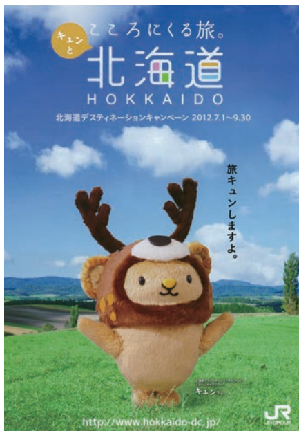
北海道DCのパンフレットは、全国のJR、旅行会社等で手に取ることができる。イメージキャラクター「キュンちゃん」の表紙が目印。

北海道DCの開催期間は、九月までの三カ月間。その後は山陰、京都と続きます。当初は観光地のPRの色合いが強かったDCも、現在は地域おこしや地域活性化のための取り組みへと変化しており、北海道でも地元観光関係企業・団体が積極的に参加。DCを通して、北海道ならではの魅力を全国に発信しています。