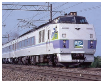
期間限定でデビューする「特急ヌプリ号」。8/6〜31まで運転。